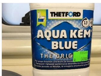
Rozkladová chemie- příklad

Před prvním použitím je nutné nalít do toalety rozkladovou chemii. Ta zajišťuje rozložení obsahu. Nalijte přibližně 1 dl nebo vložte 1 tabletu a spláchněte cca 2 lt. vody. Splachovadlo je zde. Pozor, musí být zapnuté čerpadlo. Před použitím toalety je nutné otevřít záklopku pákou pod mísou. Pozor! Vždy zase zavírat. Na splachovadle je i signalizace naplnění kazety.